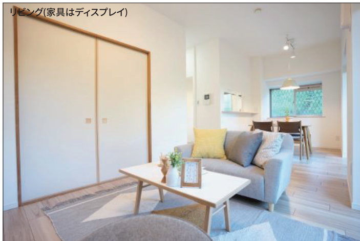
リビング(家具はディスプレイ)