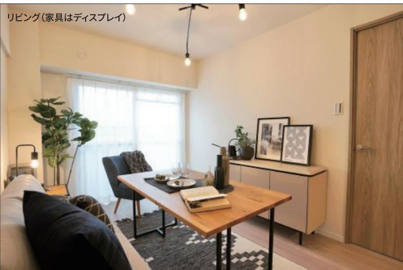
リビング(家具はディスプレイ)